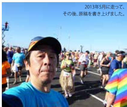
2013年5月に走って、その後、原稿を書き上げました。

今回走ったコースはこちら( http://connect.garmin.com/activity/316518679 )でご覧いただけます。サンフランシスコの名物レース、ぜひご参加あれ!