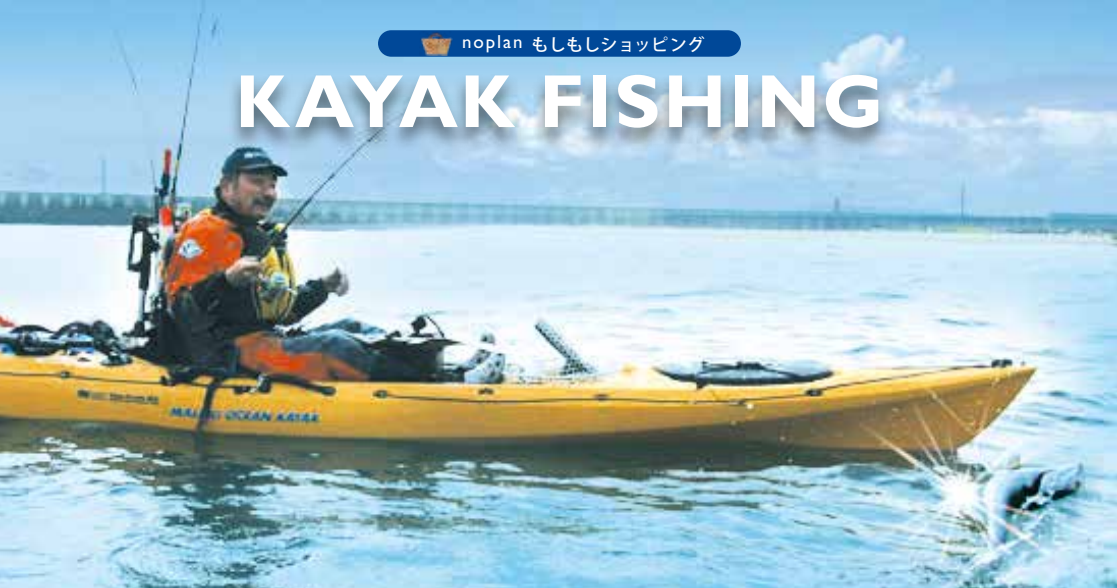
OCEAN KAYAK Trident 13 Angler